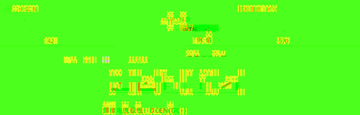
图3 金属粒子形状分布